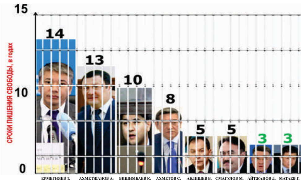
Рисунок 2 – Осужденные государственные топ-менеджеры. 20

Система борьбы с коррупцией в Казахстане создана и работает. На наших глазах за коррупционные правонарушения осужден ряд топ-менеджеров. Коррупционные приговоры широко освещаются в СМИ. На основании результатов расследований за коррупционные преступления осужден и ряд высокопоставленных силовиков, что представляется весьма показательным и полезным для казахстанского общества, так как продажные должностные лица в органах, призванных обеспечивать все виды национальной безопасности, сводят на нет усилия власти по строительству прогрессивного государства (рисунки 2 и 3).